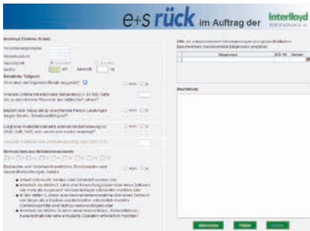
Direkte Risikoprüfung über esmeRit

Der Existenz-Schutz-Rechner der Interlloyd bietet Ihnen nicht nur vielfältige Optionen in der Wahl der unterschiedlichen Tarife, sondern auch eine schnelle und einfache Risikoprüfung. Erstellen Sie mit nur wenigen Eingaben eine bereits medizinisch geprüfte Deckungsaufgabe. Der digitalisierte Online-Rechner ermöglicht Ihnen damit eine abschließende Kundenberatung direkt vor Ort.