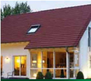
Wohngebäude Eurosecure Plus