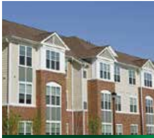
Wohngebäude Protect Plus