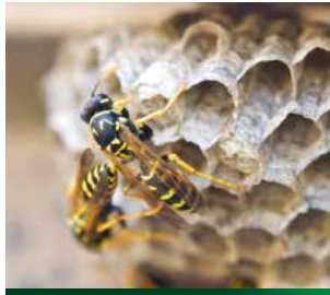
Haus- und Wohnungsschutzbrief