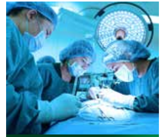
Unfall Premium Plus