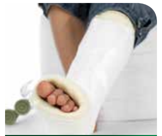
Unfall Premium Plus