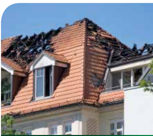
Hausrat Protect Plus